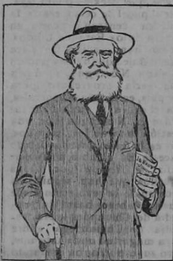
Sufrió incesantemente durante muchos años

Carros por descargar hoy en primera línea: 527, 547, 472, 683, 646 y 769